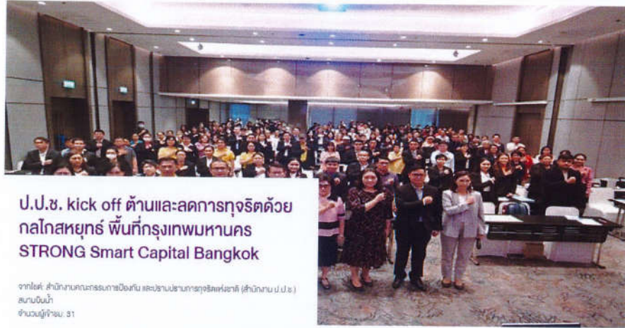
ป.ป.ช. kick off ด้านและลดการทุจริตด้วยกลไกสหยุทธ์ พื้นที่กรุงเทพมหานคร STRONG Smart Capital Bangkok

จากโต๊ะ สำนักงานคณะกรรมการป้องกันและปราบปรามการทุจริตแห่งชาติ (สำนักงาน ป.ป.ช.) สภานิติบัญญัติ จำนวนผู้เข้าชม: 31