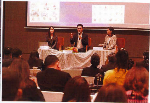
ป.ป.ช. kick off ด้านและลดการทุจริตด้วยกลไกสหยุทธ์ พื้นที่กรุงเทพมหานคร STRONG Smart Capital Bangkok

เมื่อวันที่ 16 กุมภาพันธ์ 2566 สำนักงาน ป.ป.ช. จัดกิจกรรมสัมมนาเชิงปฏิบัติการขับเคลื่อนแนวทางการดำเนินงานด้านและลดการทุจริตด้วยกลไกสหยุทธ์ เพื่อทบทวนพื้นที่เสี่ยงต่อการทุจริต (STRONG: Together against Corruption – TaC) ประจำปีงบประมาณ พ.ศ. 2566 ณ โรงแรมนิเวศกรุงเกษม บางนา กรุงเทพมหานคร